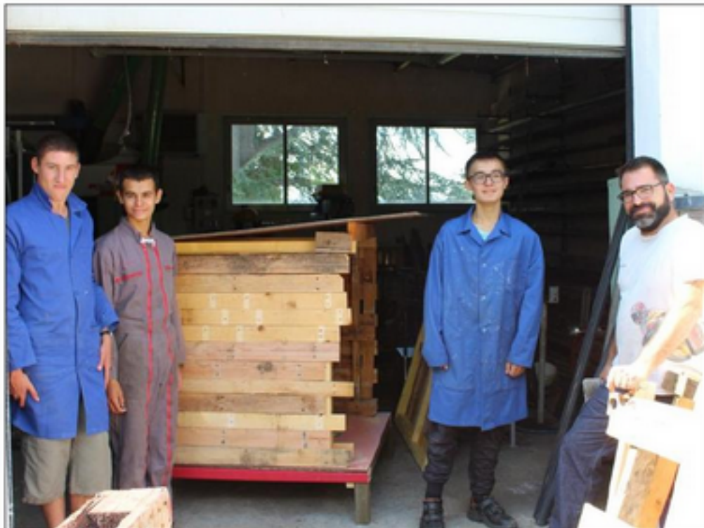
■ L'atelier espaces verts finalise la construction d'un poulailler.

Un éventail que Mathilde Moulin, la responsable de l'établissement, et son équipe souhaiteraient élargir en montant de nouveaux partenariats. Il a en effet été remarqué par l'équipe de suivi que, si les choses se passaient plutôt bien pour les jeunes, sur le plan pro-